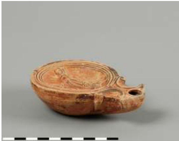
Aardewerken olielampjes (replica's) (particulier bezit)