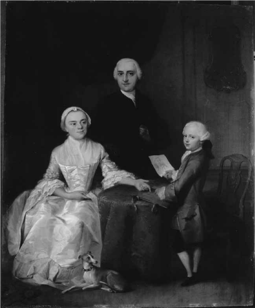
Olieverfschilderij van de Middelburgse familie Kien van Citters, door Aert Schouman, 1763. Particuliere collectie, foto Iconografisch Bureau /RKD, 's Gravenhage.