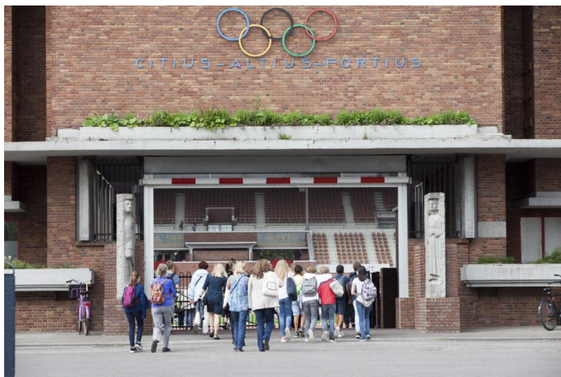
Leerlingen van het Ignatius Gymnasium Amsterdam geven buurtbewoners een educatieve rondleiding door hun wijk en eindigen de dag met een sportief programma in het Olympisch Stadion: citius, altius, fortius (sneller, hoger, sterker).