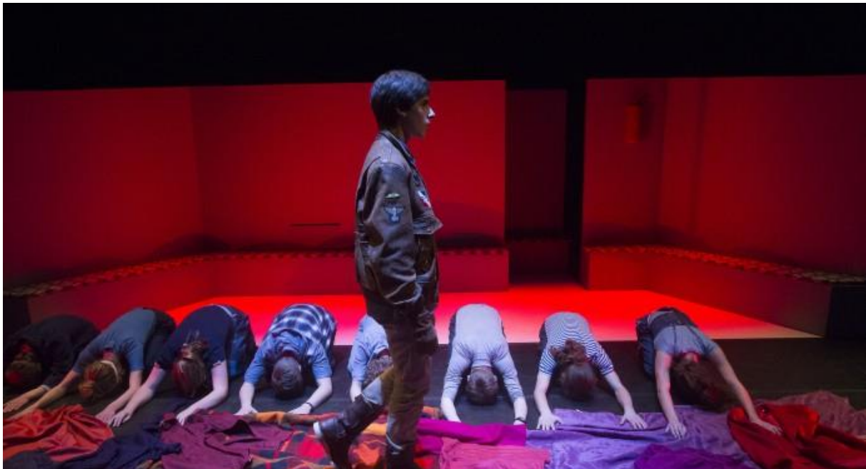
Kop van recensie en foto van hedendaagse opvoering van de Oresteia van Aeschylus: 'My bloody family' door jongerentheatergroep De Meeuw

Gebeurtenis: theatervoorstelling 'My bloody family' van Meeuw jonge theatermakers naar 'Oresteia' van Aeschylus. Regie: Carlo Scheldwacht. Gezien: gisteravond als try-out in de Harmonie te Leeuwarden ★★★★★