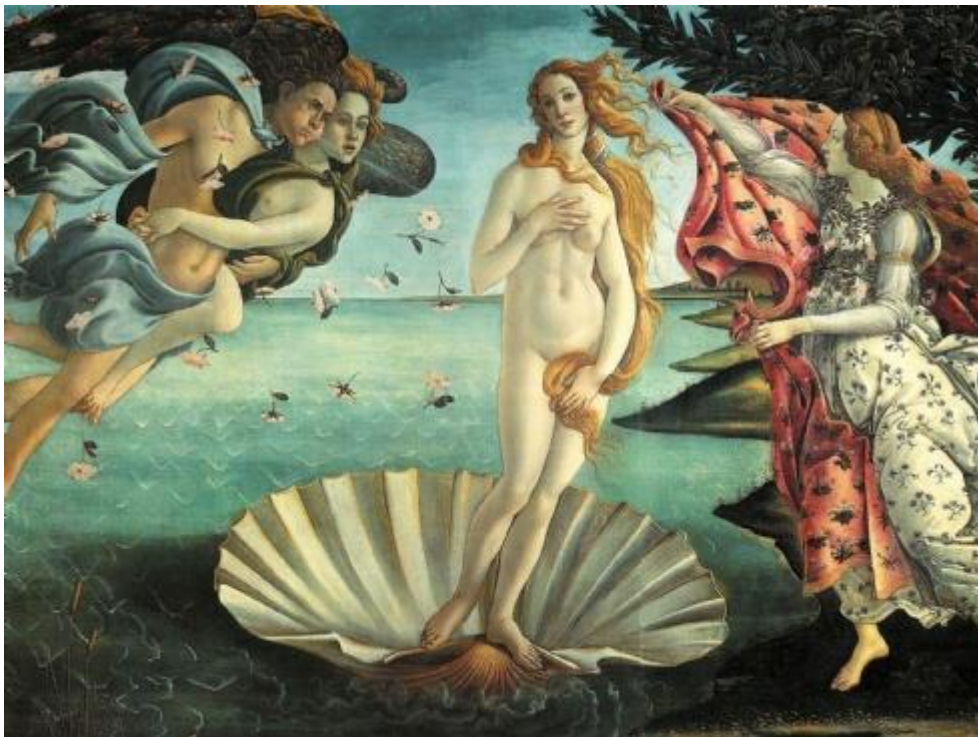
'De geboorte van Venus' van Botticelli (ca. 1445-1510). Uffizi-galerie, Florence.

Bij GLTC lezen leerlingen werken van verschillende genres. Dit leidt ertoe dat zij ook met andere vormen van kunst dan literatuur in aanraking komen. De klassieken richten zich ook op filosofie, op toneel, op beeldende kunst en architectuur, en op geschiedenis. Klassieke teksten worden bestudeerd in samenhang met een of meer van deze vakgebieden. Bovendien wordt de klassieke kunstuiting steeds ook vergeleken met (de interpretatie van) latere kunstuitingen, waarbij van de leerling verwacht wordt dat hij steeds reflecteert op de overeenkomsten en verschillen.