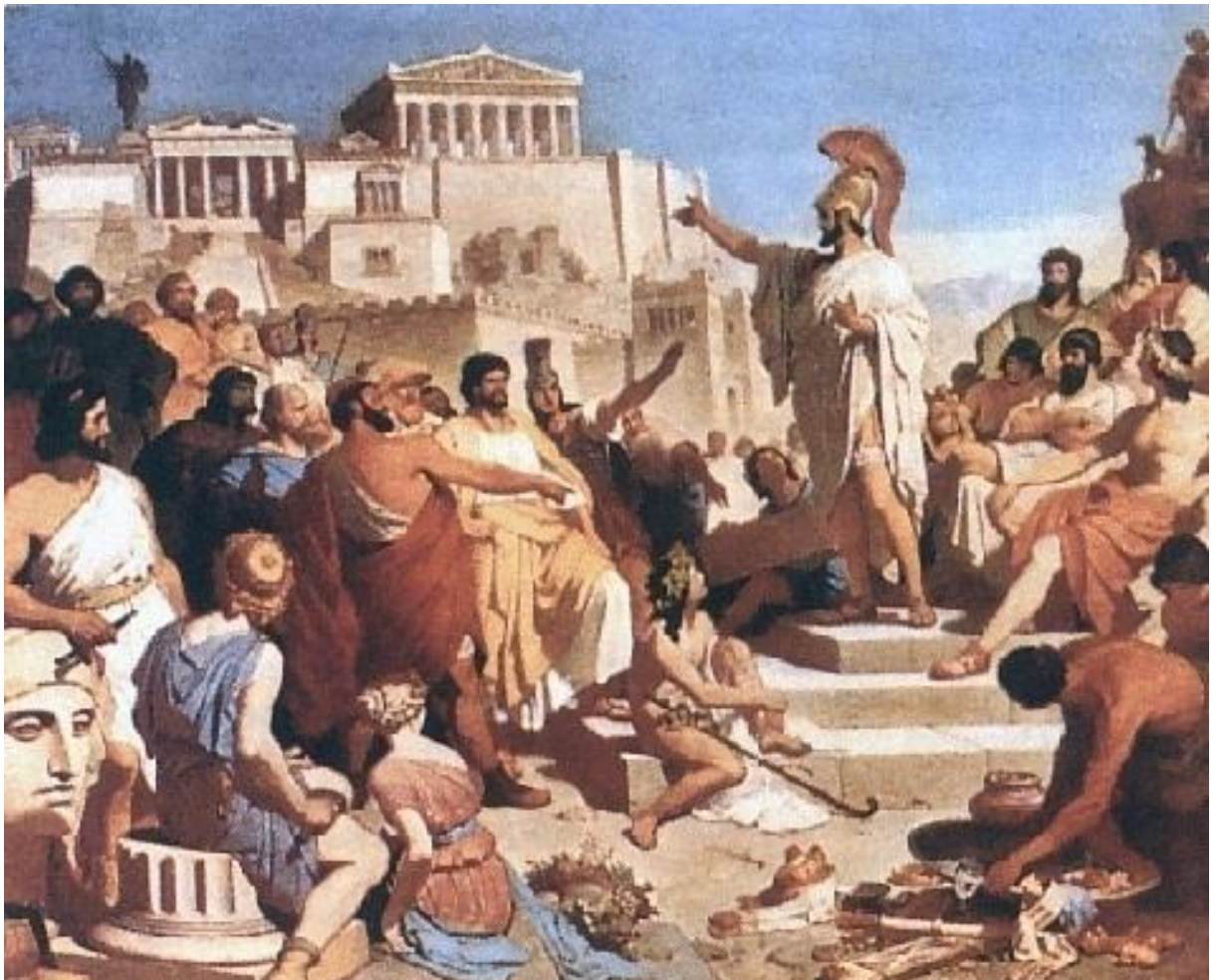
Athene als bakermat van de democratie: 'Pericles' Grafrede' door Philip Foltz (1805-1877).

Het bovenstaande is de kernboodschap van de Vereniging Classici Nederland. De vereniging werkt deze kernboodschap in dit document uit tot een visie op de rol van de Griekse en Latijnse talen en culturen in het onderwijscurriculum in Nederland.